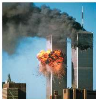
Террористический акт 11 сентября 2001 г. в Нью-Йорке

Пришедшие к власти после войны лейбористы провели национализацию ряда отраслей промышленности, расширили социальные программы. Постепенно ситуация в экономике улучшилась. В 1950—60-е гг. происходил интен-