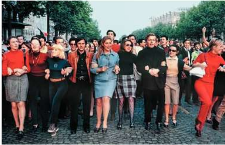
Демонстрация в Париже. 1968 г.

дер социалистической партии Франсуа Миттеран . Был проведен ряд реформ в интересах широких слоев населения (сокращение рабочего дня, увеличение отпусков), расширены права профсоюзов, национализирован ряд отраслей промышленности. Но возникшие экономические проблемы заставили правительство пойти по пути жесткой экономии. Усилилась роль правых партий, реформы были приостановлены. В 1995 г. президентом стал голлист Жак Ширак , затем — Николя Саркози . На выборах 2012 г. победу одержал социалист Франсуа Олланд , а в 2017 г. — лидер движения «Вперед!» Эмануэль Макрон .